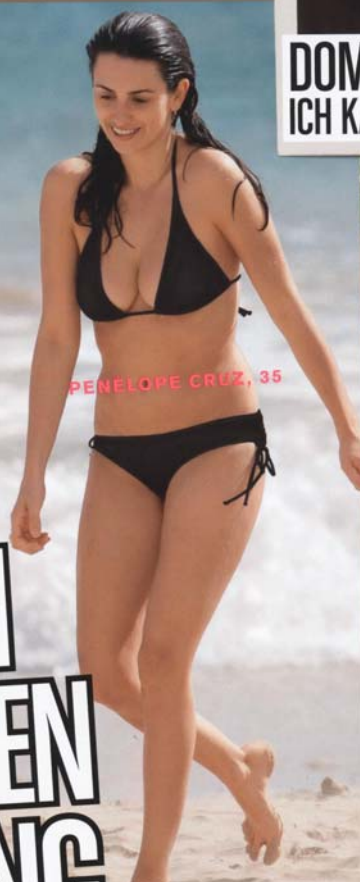
PENELOPE CRUZ, 35