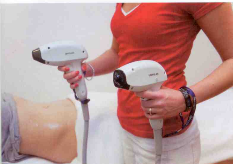
Jedna hlavice působí do hloubky tkáně, druhá na povrchu kůže