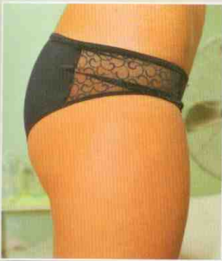
Slečna Lucie před ošetřením

Ošetření bylo velmi příjemné, byl to takový čtyřicetiminutový relax.