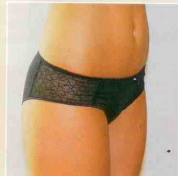
Naše čtenářka po třech aplikacích ztratila 5 cm přes boky a zhubla jí i stehna