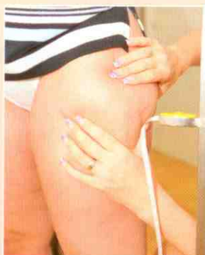
Na stehnech není prorostlé vazivo, ale tuk